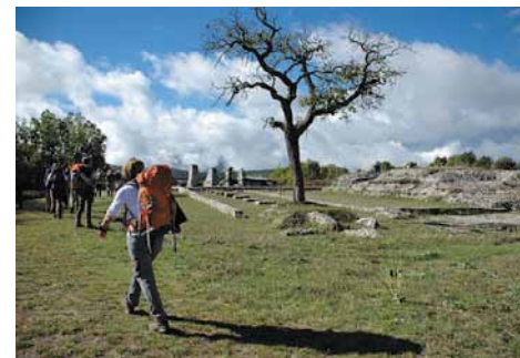
Nei pressi dell'area di Peltuinum. Near the Peltuinum area.

We proceed along the path and it takes us back onto the paved road, which connects Prata d'Ansidonia. If we cross the road it will take us to Castel Camponeschi, one of the Tratturo Magno fortresses. Continuing along a lovely scenic trail we enjoy a view of the entire plain with the Tratturo and Peltuinum. We will now have reached charming Tussio and we can return to the tarmac road to the north west, cross Prata San Pio delle Camere and find ourselves back at the starting point.