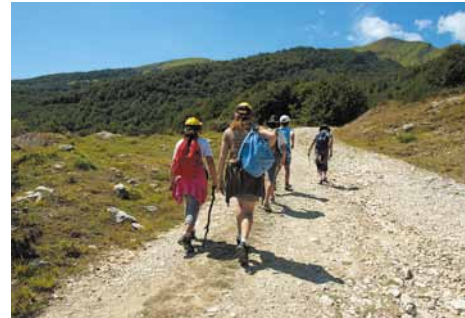
Tratto iniziale del percorso. Start of the trail.

La suggestiva Valle delle Cento Cascate prende il nome dal numero delle cascatelle (circa 100) che il torrente Fosso dell'Acero alimenta nella sua vorticoso discesa tra i faggi secolari; l'area è punteggiata da stupendi fiori selvatici, tra cui diverse specie di orchidee.