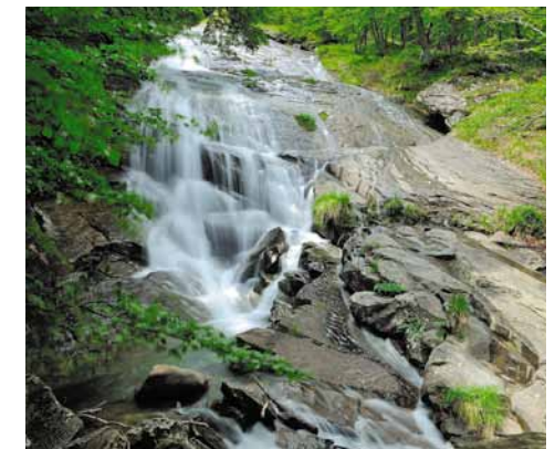
Una delle cento cascate. One of the Cento Cascade waterfalls.

Following the trail for about 3km we reach the fork (359), turn right onto the dirt track (6) in the Vercereti district. After 2km we return to our starting point.