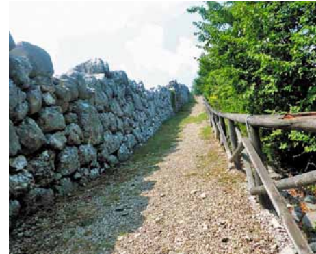
Le mura megalitiche. Megalithic walls.

Il percorso prende avvio dal Centro Visita per poi scendere verso la depressione del Lago Nero (2); lasciando il sentiero e la valle del Lago sulla sinistra, si prosegue per un percorso in salita segnalato da cartelli. Sul punto più a nord, in corrispondenza di un salto di roccia e di un belvedere che da su Tornareccio (3), il sentiero piega a sud-ovest per giungere sotto le imponenti mura megalitiche del V sec. a.c. (4). Seguendo la strada asfaltata, si giunge al parcheggio della Madonna dove si può visitare, con una breve deviazione, l'abitato romano (5). Tornando sul tracciato e costeggiando il costone di roccia, si sale sul punto più alto (925 m) da dove si erge una torretta e si apre un ampio panorama che spazia dalla Majella alle isole Tremiti (6). Sempre costeggiando il costone, prima sulla sinistra e poi sulla destra, si giunge alla chiesetta degli Alpini (7) da cui, dopo aver percorso la strada asfaltata, il sentiero discende verso il Centro Visita attraverso boschi di querce e frassini. Il Parco di Monte Pallano è considerato di tipo archeologico grazie ai ritrovamenti risalenti al periodo italoico e allo stesso tempo naturalistico per le affascinanti rocce carsiche e un raro pascolo primario in quota caratterizzato da flora e fauna ricche di endemismi quali il carpino orientale e specie protette quali il lupo, la raganella itolica, il cerambix cerdo e la zerynthia polyxena.