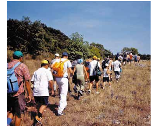
Escursione di gruppo sul circuito. Group outing on the circuit.

Parco di Monte Pallano is classified as an archaeology park for its finds dating to the Italic period, but also as a nature park for its fascinating karst rocks and rare, high-altitude primary pasture characterized by rich flora and fauna like the endemic oriental hornbeam and protected species such as the wolf, Italian tree frog, great capricorn beetle, and southern festoon butterfly.