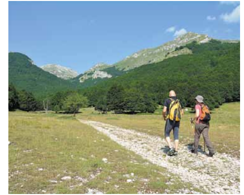
L'inizio del sentiero a Capo Pezza. The start of the Capo Pezza route.

Questo sentiero risulta impegnativo per via del dislivello; quindi valutare le proprie condizioni fisiche e tornare indietro quando si è stanchi.