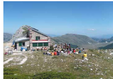
Il rifugio Sebastiani. The Sebastiani refuge.

This trail is challenging because of the height differences so we should be sure we are fit enough, and turn back if we feel tired.